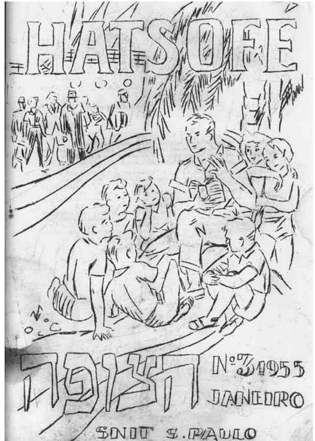
שער חוברת שכבת 'הצופה' (גילאי 9-11) של תנועת הנוער 'דרור', סאו פאולו 1955

נדרשה תחלופה רצופה של הפעילים המרכזיים בתנועה, שכן פעם אחר פעם עלו חברי ההנהגה ארצה. מבחינת מספרית הוכחה תקפותה של ההחלטה לחייב את הבוגרים לעלות ארצה, כאשר התנועה הצליחה בעקביות לייצר מתוכה מחדש הנהגה ראויה ובה בעת להעמיק את היקף פעולתה, כפי שהדבר ניכר בנתונים משנת 1956. ביהדות ארגנטינה, שמנתה כ־300,000 נפש, היו עשרים ושלושה סניפים של תנועת 'דרור', ובהם 1,222 חניכים. לעומת זאת בברזיל, שיהודיה מנו כשליש ממספרם של יהודי ארגנטינה, היו לתנועת 'דרור' שבעה סניפים, ובהם 1,020 חניכים. בשנים 1952-1956 עלו מארגנטינה לישראל 378 בוגרי 'דרור' (230 מהם שהו טרם עלייתם בחוות הכשרה), ומברזיל עלו 234 בוגרי התנועה (143 מהם שהו טרם עלייתם בחוות הכשרה). 68 נתונים אלה השתקפו גם בהיקף העלייה מהארצות הללו באותה תקופה: מהקמת המדינה ועד 1960 עלו ארצה מארגנטינה 4,040 יהודים, לעומת 1,704 יהודים שעלו מברזיל. 69 הגישה שנועדה להבטיח כי גרעין גדול של ברזילאים יחיה בקיבוץ אחד וישמש לאורך ימים כאמצעי קשר עם הקהילה היהודית בברזיל וכגורם