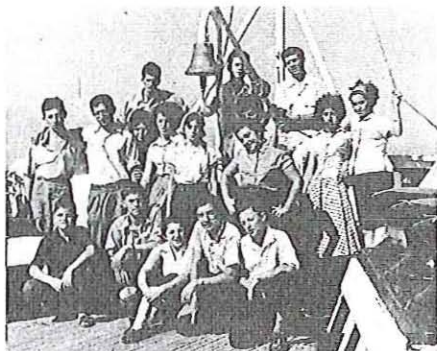
באניה עם קבוצת עליית הנוער