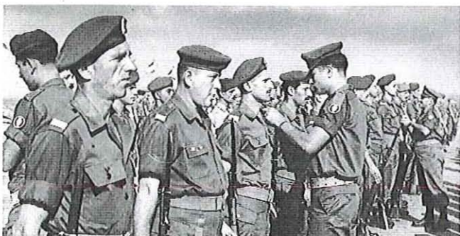
מקבל דרגת קצונה