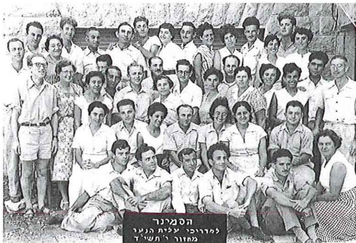
בסמינר למדריכי עליית הנוער