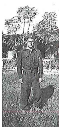
בנח"ל בקיטץ אפיקים