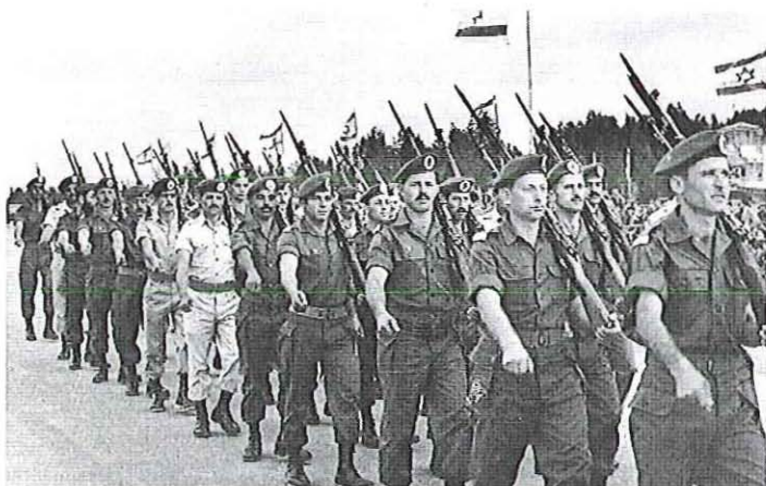
מצעד בבית ספר לקצינים