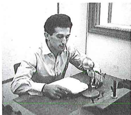
משדר ל"קול ציון לגולה"