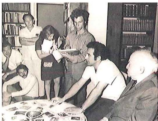
עם הסמינר של המנהיגים הפוליטיים בביתו של בן-גוריון בתל-אביב