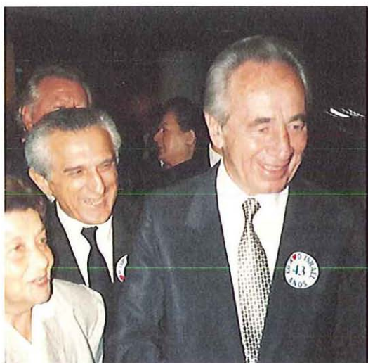
עם פרס בסאו-פאולו, ברזיל