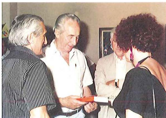
פרס מכבד אותנו בהשקת המילון שערכנו