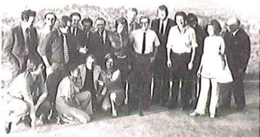
Reunión del Buró de la Internacional Socialista SANTAGO DE CHILE DEL 7 AL 9 DE FEBRERO DE 1973