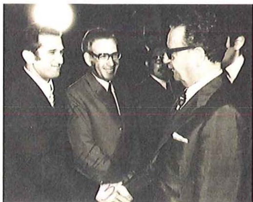
עם נשיא צילה סלבדור איינדה